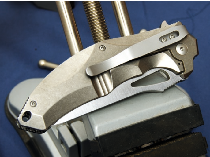
Ein schöner Rücken entzückt auf jeden Fall: Der Frame-Lock aus Titan ist beim Darkstalker ebenfalls ergonomisch geformt.