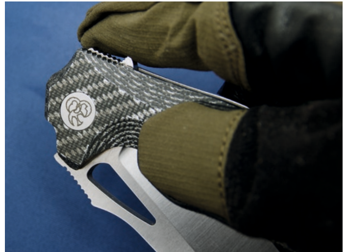
Zwei Optionen: Das Daumenloch funktioniert gut, aber vor allem mit Handschuhen geht das Öffnen per Flipper leichter.

» Freunde scharfer Klingen machen bei einer Reise nach Wien meist einen kurzen Abstecher in die Sechshauser Straße: zum Messerkönig. Das Fachgeschäft inmitten der Metropole bietet nicht nur eine tolle Auswahl und einen guten Schleifservice, sondern ist auch durch seine Modelle in Eigenfertigung bekannt.