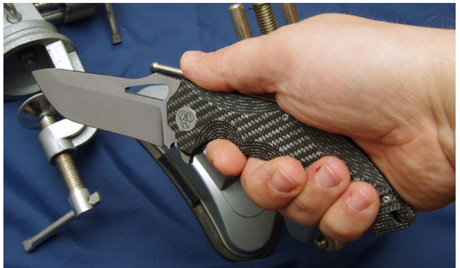
Tolle Handlage: Das Darkstalker MiniSlim V2 ist so flach, wie es der Name verspricht, füllt die Hand aber trotzdem sehr gut aus.

Alle Darkstalker-Modelle begeistern durch eine starke Optik, da macht das MiniSlim V2 keine Ausnahme. Die große Tanto-Klinge ist zwar nicht jedermanns Geschmack, aber ansonsten verleihen ihm der geschwungene Griff und das längliche – an Raubtieraugen erinnernde – Daumen-